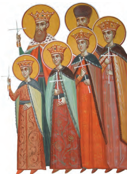
Sfântul Voievod Mucenic Constantin Brâncoveanu și fiii săi, Constantin, Ștefan, Radu, Matei, precum și Ianache sfetnicul sunt prăznuiți la 16 august.

Moaștele ei se găsesc la Mănăstirea Sfânta Ecaterina din Sinai și este sărbătorită la 25 noiembrie.