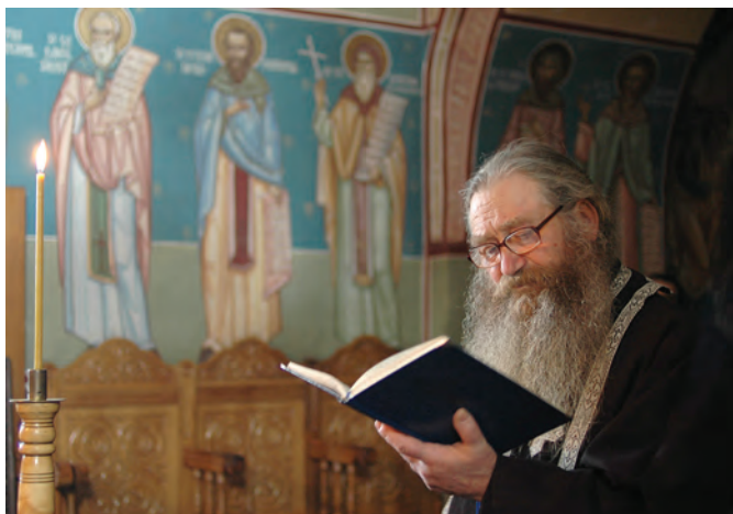
Preot călugăr la rugăciune

Spiritualitatea răsăriteană a adunat această experiență a iubirii frumuseții divine și a virtuții într-o culegere de scrieri care poartă numele de Filocalie . Cuprinde texte scrise de Sfinți Părinți care au avut o profundă cunoaștere a sufletului omenesc și a relației acestuia cu Dumnezeu, dobândită în liniștea pustiei sau a chiliei. Filocalia este o carte esențială în viața creștinilor, în special a monahilor. Ea deschide calea către o lucrare personală prin care omul urcă treptele frumuseții duhovnicești către Izvorul acesteia. Viața monahală pune în practică învățăturile Filocaliei , kalogeros (din care provine cuvântul „călugăr”) însemnând în limba greacă „bătrân frumos”.