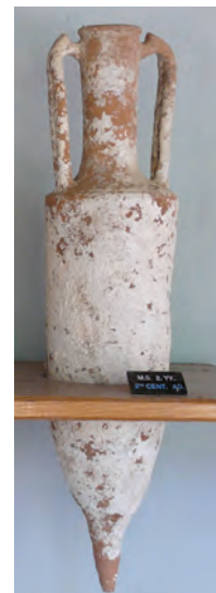
Amforă pentru măsurarea talanților

În Antichitate printre unitățile de măsură folosite pentru masă se număra și talantul. În Grecia antică un talant avea 26 kg, fiind echivalent cu masa de apă necesară pentru a umple o amforă. Există și o monedă cu acest nume.