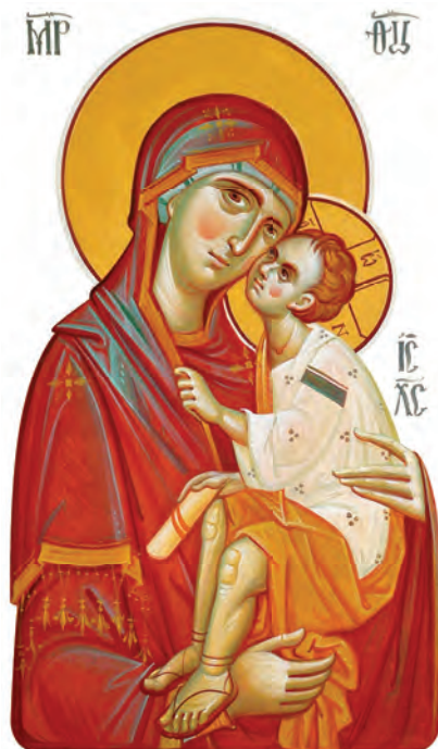
Maica Domnului cu Pruncul

Tu, Maica Domnului, ești locul tuturor harurilor, plinătatea a toată frumusețea și bunătatea, tablou și icoană însuflețită a tot binele și a toată bunătatea. (...)