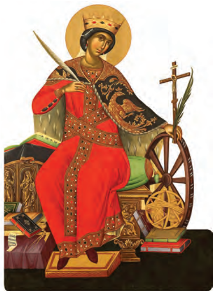
Sfânta Muceniță Ecaterina (287-305)

Moaștele ei se găsesc la Mănăstirea Sfânta Ecaterina din Sinai și este sărbătorită la 25 noiembrie.